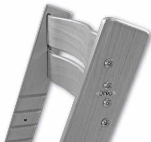
Tvarované opěrky zad

Starší děti by měly mít jednu opěrku nastavenou tak, aby mezi opěrkou a sedátkem byl takový prostor, aby se pánevní kost opěrky nedotýkala, sed nebyl kulatý, ale rovný, podepřený v bedrech. Polohováním opěrek do jednoho ze čtyř otvorů v boku židle dokážete optimálně zajistit správné podepření páteře po celou dobu růstu vašeho dítěte. V možnosti nastavení bederních opěrek je židle Jitro® mezi vysokými židlemi unikátní.