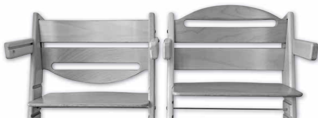
Správně umístěná zvýšená opěrka zad

1. Odhadneme nebo změříme vzdálenost od konce pánevní kosti po konec prohnutí páteře směrem dopředu (výšku beder) a rozhodneme, zda použijeme jednu nebo dvě opěrky zad nebo pouze širší z opěrek. Pro děti do dvou let použijeme obě opěrky zad. Vyšší z nich ( ZVO ) vložíme do prvního otvoru shora v případě, že sedák musí mít dítě vzhledem k vašemu stolu v nejvyšší poloze. Pokud sedák bude mít dítě nastavený ve druhé drážce shora, nasadíme širší opěrku do čtvrtého otvoru shora, obloukem směrem dolů. Tím zamezíme podklouznutí malého dítěte prostorem pod opěrku.